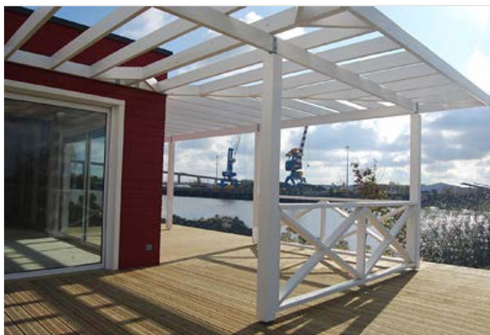
Un quartier en bordure de Loire, parfaitement intégré au paysage.